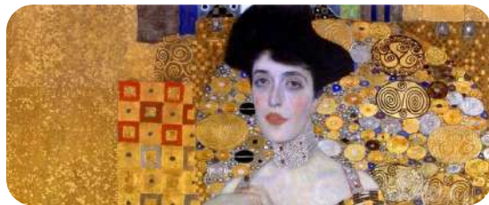
Inaugurazione 1 Maggio ore 12:00 "La magia floreale del Liberty" ex palazzo del turismo, viale Verdi, 68 Montecatini Terme 1-2-3 Maggio 15:00 - 19:00

Le terme furono non solo luoghi di cura ma divennero veri e propri centri di incontro dove la cultura e il divertimento resero la città competitiva a livello europeo, al punto che dopo 100 anni, Montecatini Terme è tra le 11 Grandi Città Termali d'Europa (unica in Italia) tra i siti Patrimonio dell'Unesco.